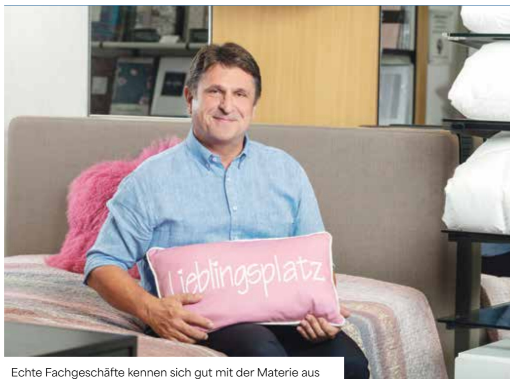
Echte Fachgeschäfte kennen sich gut mit der Materie aus

Das System Mensch arbeitet, wie bei den meisten Lebewesen, im Schichtbetrieb. Am Tag nehmen wir Nahrung und Informationen auf, die nur im Schlaf, während der Nacht, verarbeitet werden können. Aus diesen drei Quellen, Bewegung, Essen und Schlafen, schöpfen wir demnach unser Leben, und steuern im Wesentlichen unsere Gesundheit. Na-