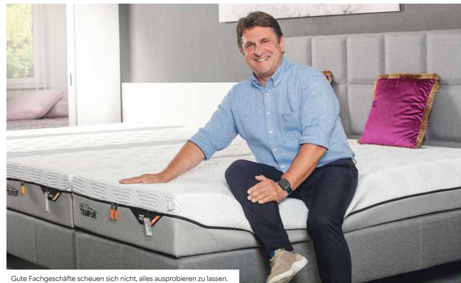
Gute Fachgeschäfte scheuen sich nicht, alles ausprobieren zu lassen.