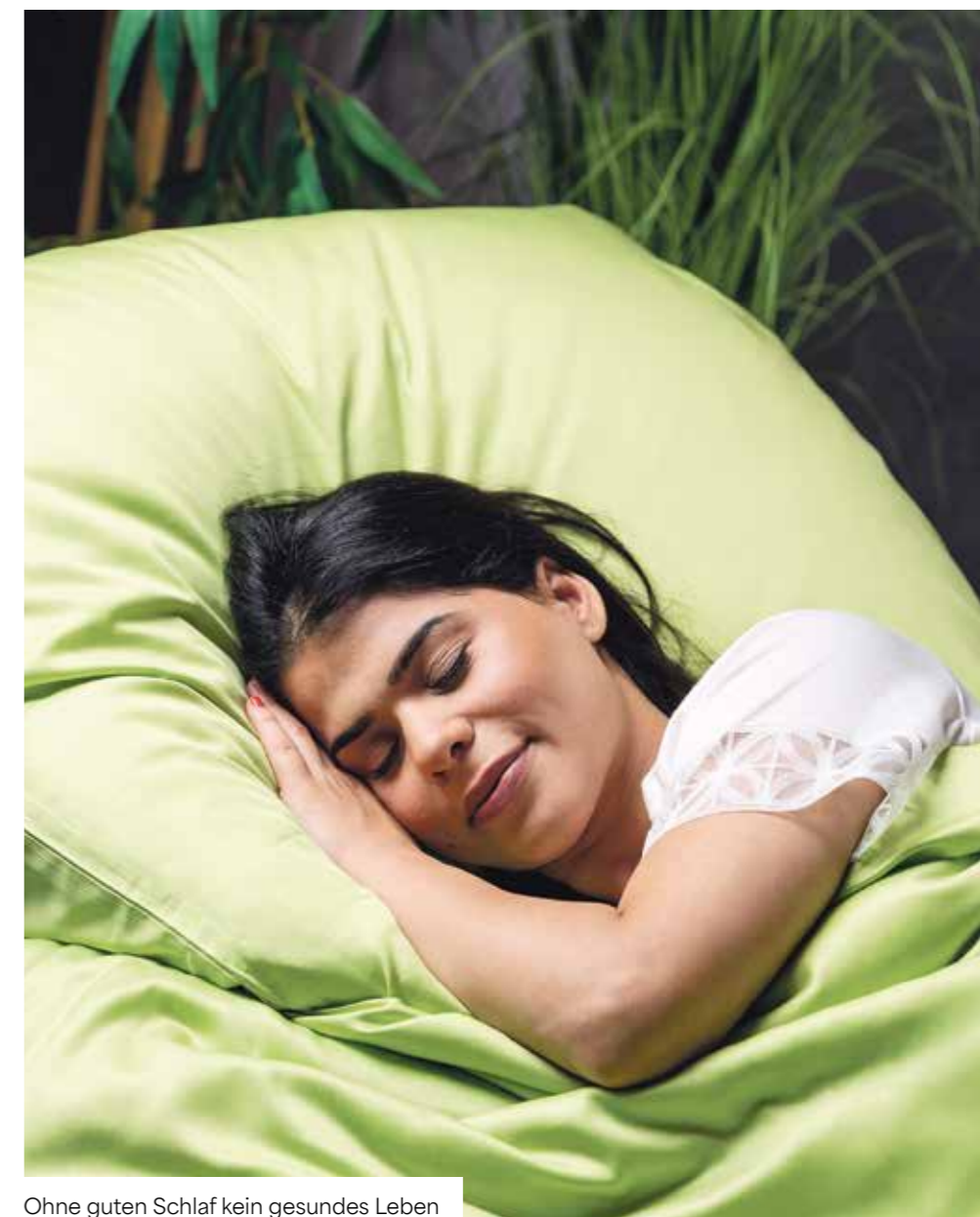
Ohne guten Schlaf kein gesundes Leben

„So, wie der Schlaf individuell ist, muss es das Bett auch sein.“